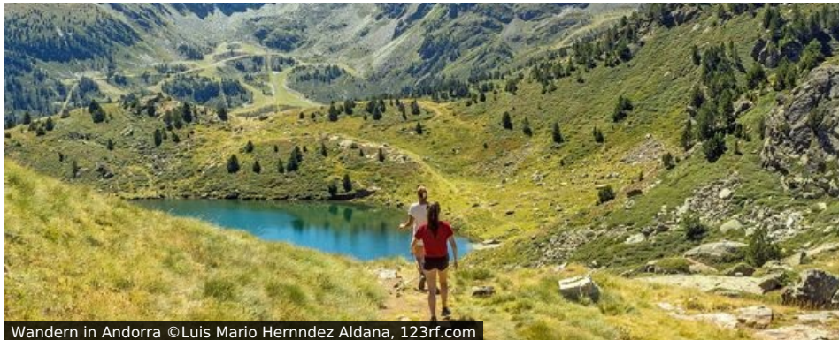
Wandern in Andorra

Zwergstaat - mit diesem Attribut wird Andorra wohl am häufigsten assoziiert. Und tatsächlich ist das Land in den Pyrenäen mit seinen gut 75.000 Einwohnern nicht gerade das größte unter der Sonne. Für uns aber ist etwas anderes wichtiger: Andorra ist mit allein 65 Gipfeln über 2.000 Meter der „Bergstaat“ schlechthin und damit ein Wanderparadies mit unerschöpflichem Potenzial von spektakulären Aus- und Einblicken. Zur Illustration: Hätte Deutschland pro Einwohner so viele Zweitausender, müssten rund um die Zugspitze noch einmal ca. 70.000 Gipfel Platz finden.