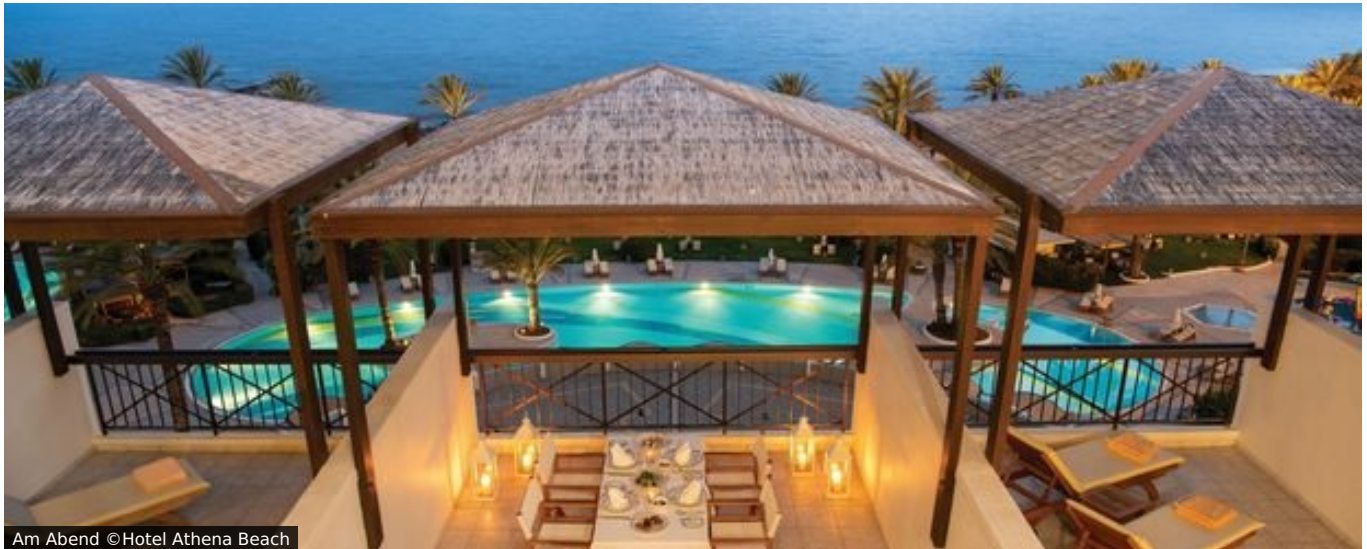
Am Abend