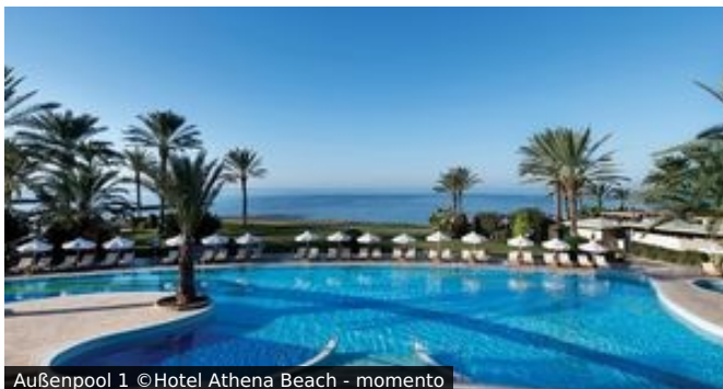
Außenpool 1