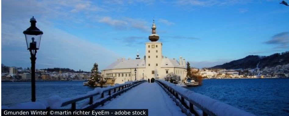
Gmunden Winter