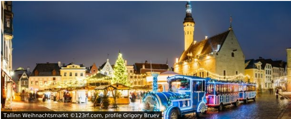
Tallinn Weihnachtsmarkt

Wenn Kerzen und Lichter die Fenster und Straßen erleuchten, dann ist Weihnachten nicht mehr weit. Tallinn im Nordosten Europas zeigt sich dann von seiner festlichsten Seite und im winterlichen Gewand. Und mit Helsinki vielleicht dazu (?) erwarten Sie gleich zwei Stadtschönheiten bei dieser Reise - voller mittelalterlicher Architektur, moderner Lebensart und gespickt mit Adventsidylle.