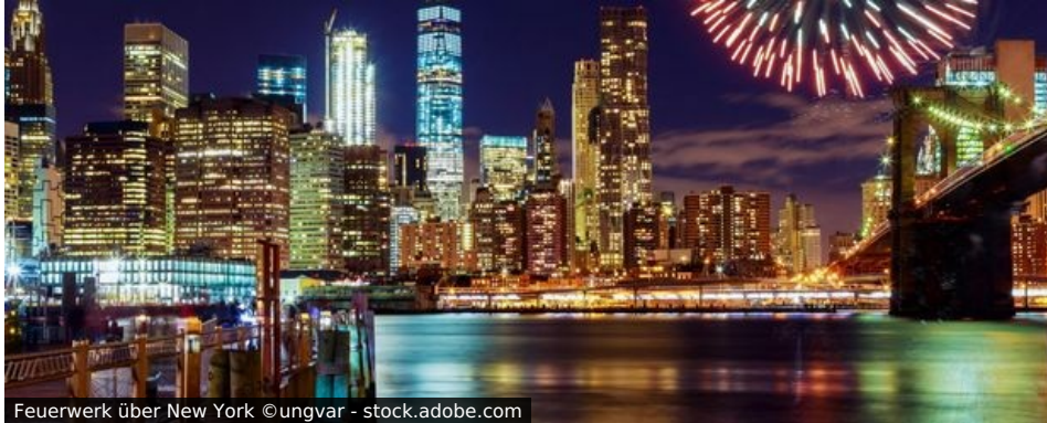
Feuerwerk über New York

„Die Stadt, die niemals schläft!“ Auch in der Nacht vom 31.12. auf den 1.1. macht New York seinem Namen alle Ehre, denn wohl nirgends wird das neue Jahr mit ähnlich spektakulärer Inszenierung begrüßt.