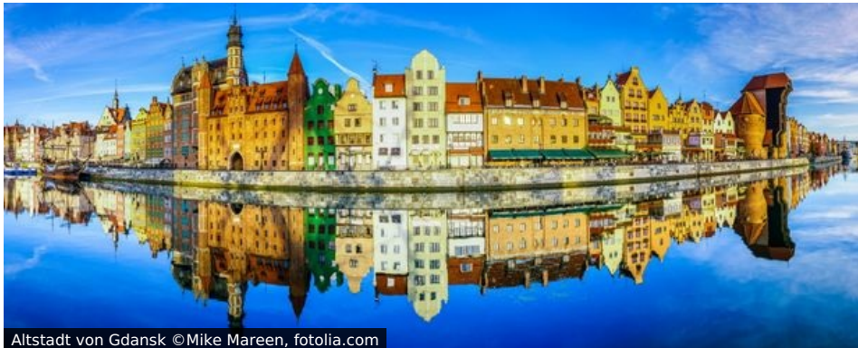
Altstadt von Gdansk

Die „Perle der Ostsee“ liegt an der Mündung der Weichsel. Danzig - bedeutende Hansestadt des Mittelalters, Anfang des letzten Jahrhunderts freie Stadt, zum Ende des Ostblocks Ausgangspunkt der polnischen Demokratiebewegung - die Stadt glänzt in schönster Pracht und präsentiert seine reiche Geschichte.