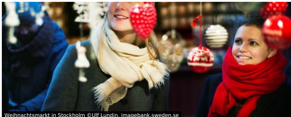
Weihnachtsmarkt in Stockholm

Wer einmal zur Adventszeit im blaugelben Möbelhaus eingekauft hat, weiß, dass die Schweden eine ganz besondere und stimmungsvolle Beziehung zur Advents- und Weihnachtszeit pflegen. Höchste Zeit, den „Glögg“ (Glühwein), das „Julbord“ (Weihnachtsbüffet) und die Lichterpracht im Vorfeld des Lucia-Tages einmal im Original zu erleben und nicht in Papptüten nach Hause zu tragen.