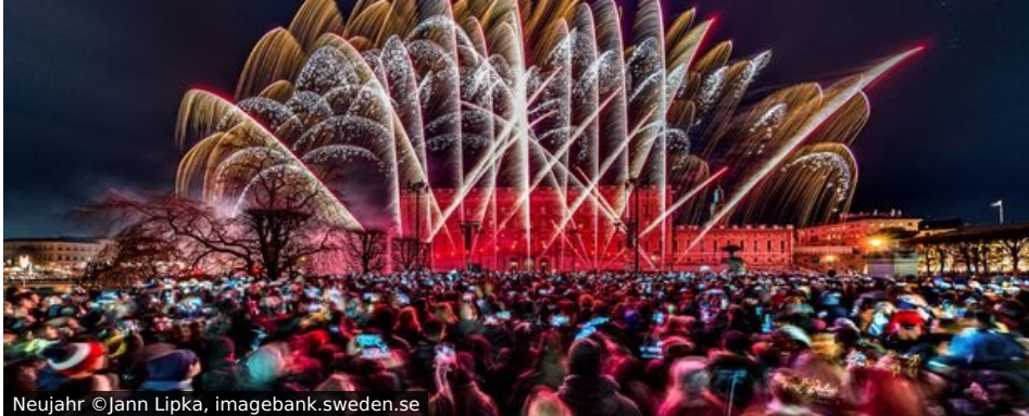
Neujahr

Vermutlich haben Sie sich noch nie gefragt, wie es wäre, bei Pippi Langstrumpf oder Michel aus Lönneberga Silvester zu feiern. Nach dieser Reise kennen Sie trotzdem die Antwort - wenn Sie möchten aus eigener Anschauung. Denn eine typisch schwedische Silvestersause findet ganz stilecht im historischen Gebäudeensemble des Freilichtmuseums Skansen in Stockholm statt, wo über 150 Gebäude aus fünf Jahrhunderten und u.a. in die Welt der Astrid Lindgrn Abenteuer entführen.