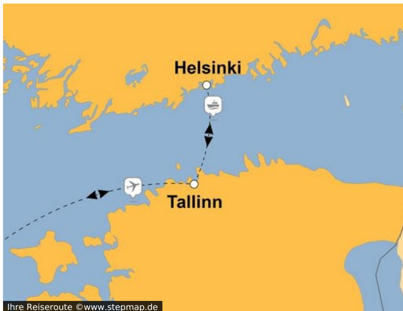
Ihre Reiseroute

Wenn Kerzen und Lichter die Fenster und Straßen erleuchten, dann ist Weihnachten nicht mehr weit. Tallinn im Nordosten Europas zeigt sich dann von seiner festlichsten Seite und im winterlichen Gewand. Und mit Helsinki vielleicht dazu (?) erwarten Sie gleich zwei Stadtschönheiten bei dieser Reise - voller mittelalterlicher Architektur, moderner Lebensart und gespickt mit Adventsidylle.