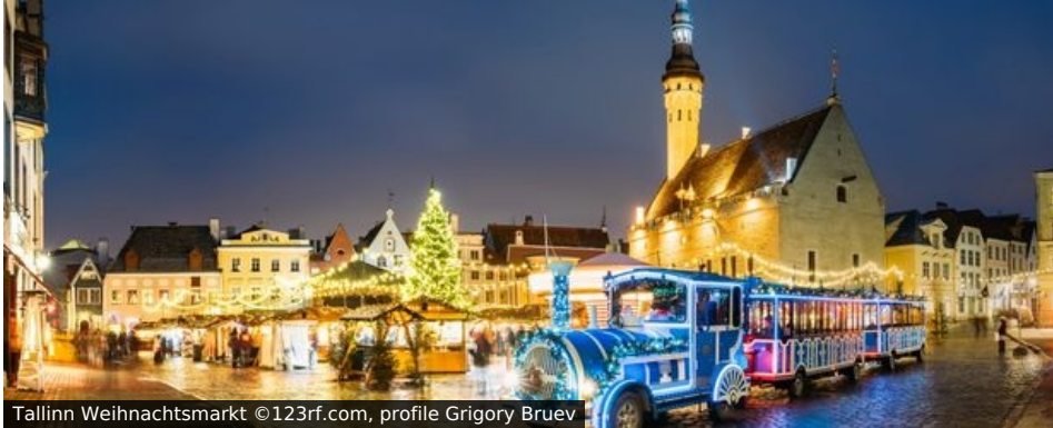
Tallinn Weihnachtsmarkt