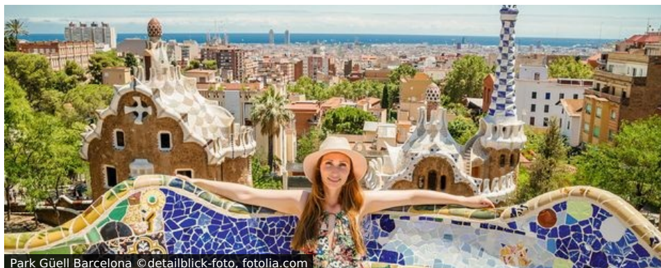
Park Güell Barcelona

Kommt Ihnen beim Namen Barcelona auch unwillkürlich der gleichnamige Hit von Freddy Mercury und Montserrat Caballé in den Sinn? Jetzt haben Sie einen Ohrwurm? Sorry, das wollten wir nicht. Am besten werden Sie ihn wieder los, wenn Sie mit uns in die katalanische Hauptstadt reisen, um selbst zu sehen, warum Barcelona eine eigene Hymne verdient hat. Das liegt nicht zuletzt am genialen Architekten Antoni Gaudí, der nicht nur mit der Basilika Sagrada Família, die sich seit 1882 im Bau befindet und 2026 fertiggestellt werden soll, seine genialen Spuren in der Stadt hinterlassen hat. Etwa den Park Güell mit der berühmten Bank aus Bruchkeramik, den Gaudí als Märchenwald gestaltet hat.