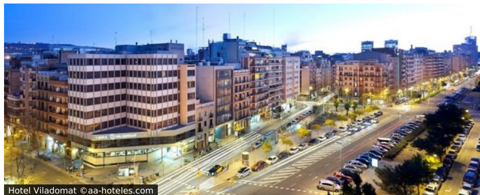
Hotel Viladomat

Lage: Das zentral gelegene 3*-Hotel Viladomat in Barcelona befindet sich nur wenige Gehminuten von der Placa d'Espanya entfernt zwischen Hauptbahnhof und Messegelände. Metrostationen befinden sich in unmittelbarer Nähe.