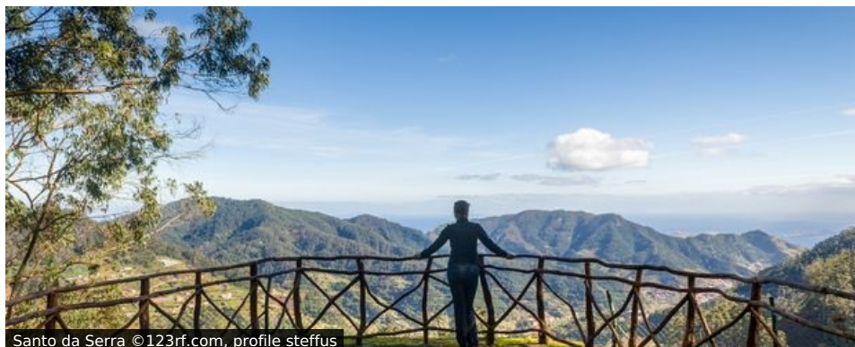
Santo da Serra

Portugals Paradies heißt Madeira. Eine Insel, die sich in punkto Vegetation verschwenderisch zur Schau stellt. Für die faszinierenden Schönheiten, die sich hier über die Täler, Berge und Hügel ergießen, darf man ruhig das Tempo drosseln. „Der Weg ist das Ziel“, wie Konfuzius einst sagte. Recht hat er. Auf dieser immergrünen, immer blühenden Insel mitten im Atlantischen Ozean haben Sie auf Schritt und Tritt das Gefühl, angekommen zu sein.