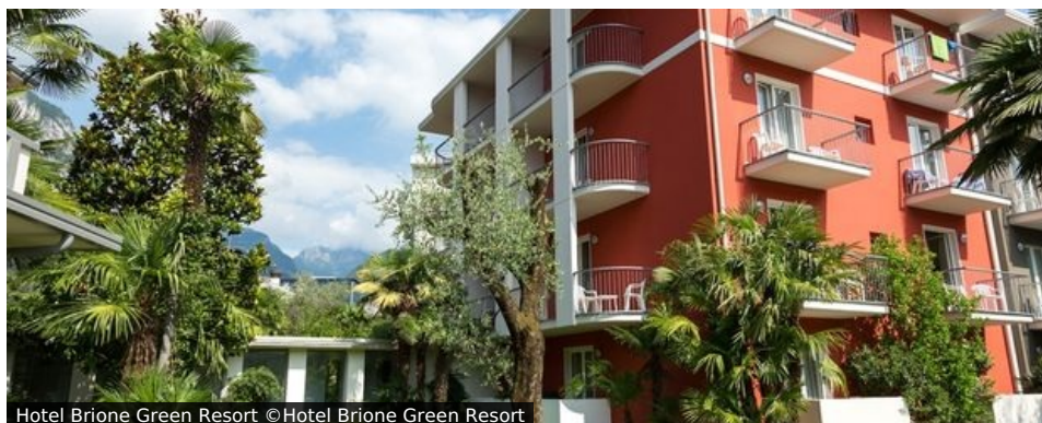
Hotel Brione Green Resort