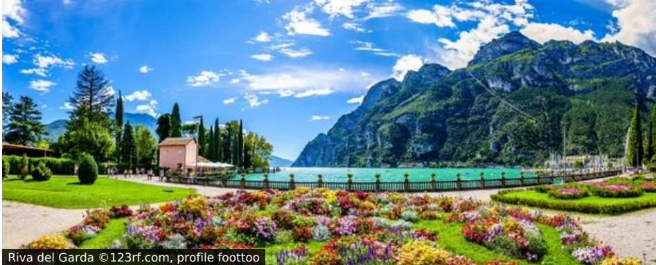
Riva del Garda