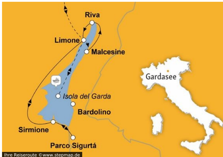
Ihre Reiseroute

Sie erwarten von Ihrem Urlaub nicht weniger als ein Wunder? Nichts leichter als das! Begleiten Sie uns an den wundervollen Gardasee und sehen Sie mit eigenen Augen, wie Wasser zu Wein wird. Wenden Sie sich vom palmenbestandenen Ufer nach Süden und blicken Sie in die Anbaugelände des Lugana. Richten Sie die Augen nach Osten, und Sie entdecken, wo Bardolino, Soave und Valpolicella zu ihrer aromatischen Reife gelangen, von der Sie sich während einer Weinprobe mit eigenen Sinnen überzeugen können.