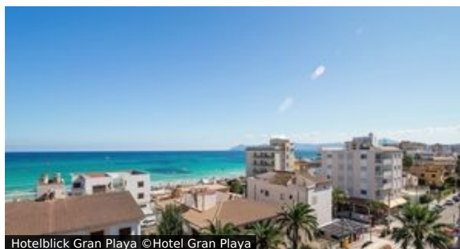
Hotellblick Gran Playa

Lage: Das Hotel ist zentral gelegen und nur 50 Meter vom wunderschönen 17 Kilometer langen Sandstrand entfernt. In der Nähe befinden sich Geschäfte und Unterhaltungsmöglichkeiten.