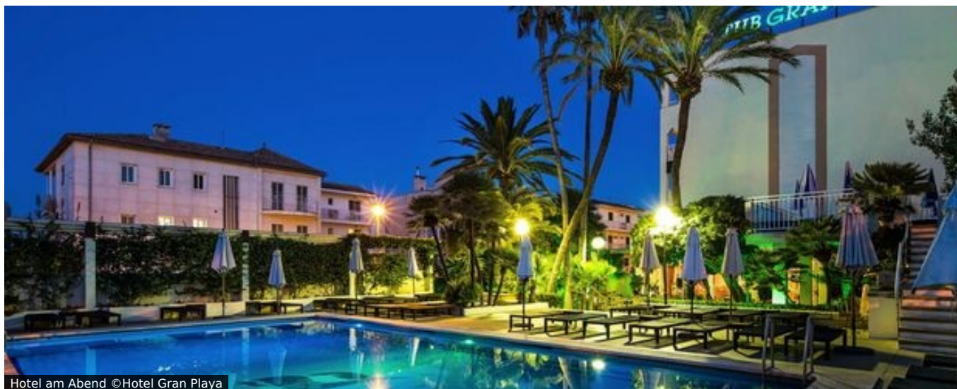
Hotel am Abend