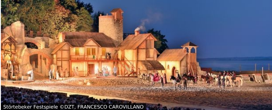
Störtebeker Festspiele