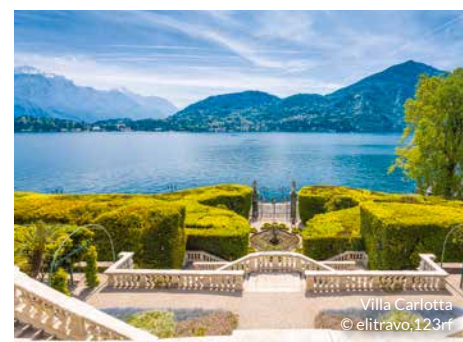
Villa Carlotta

4*-Hotel Leonardo da Vinci: Ihr Hotel liegt in Erba etwa 700 m vom Ortszentrum entfernt. Die geräumig und freundlich eingerichteten Zimmer verfügen über TV, Telefon, Klimaanlage, Bad oder Dusche/WC mit Haartrockner sowie Safe und Minibar.