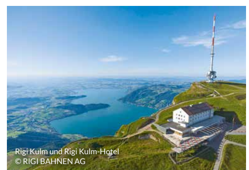
Rigi Kulm und Rigi Kulm-Hotel

Das ausführliche Programm erhalten Sie unter sz-reisen.de und im Reisebüro.