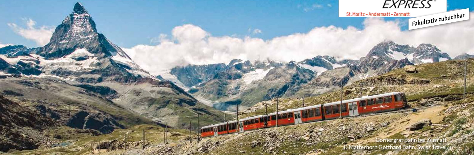
Gornergrat Bahn bei Zermatt