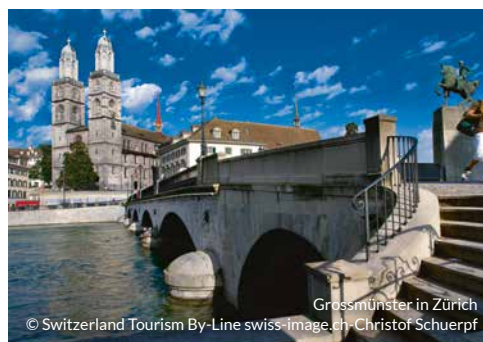
Grossmünster in Zürich