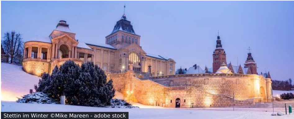
Stettin im Winter

Eine doppelte Grenzerfahrung der angenehmsten Sorte erwartet Sie auf dieser Silvesterreise nach Stettin. Denn Sie überschreiten nicht nur die Jahresgrenze, sondern auch die zwischen Deutschland und Polen – Letztere gleich mehrfach.