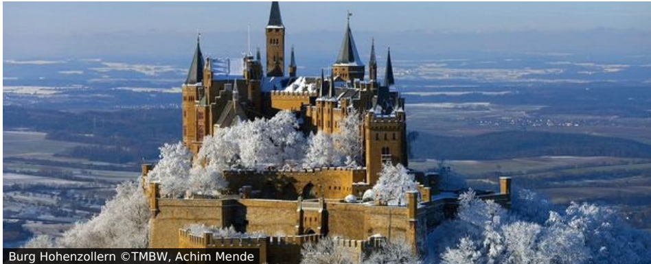
Burg Hohenzollern