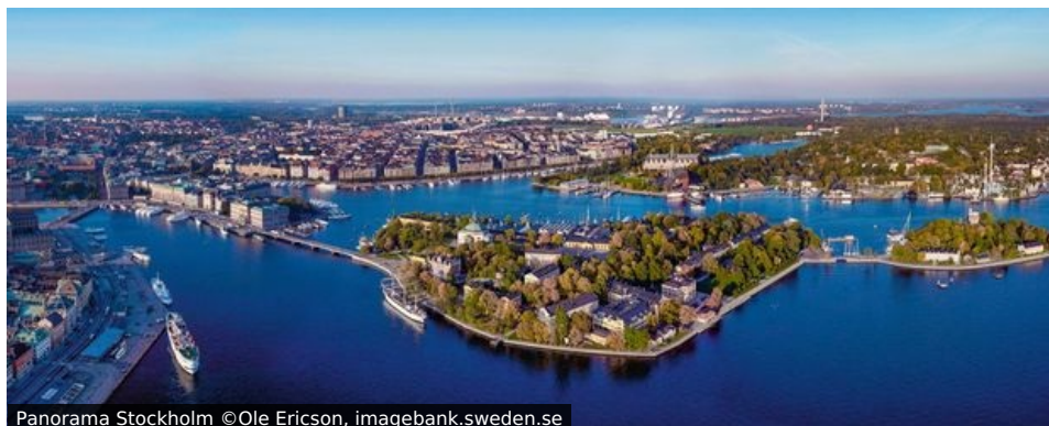
Panorama Stockholm

„Venedig des Nordens“, „Kleinste Großstadt der Welt“, „Hauptstadt von ABBA-Land“ – Stockholm hat so viele Beinamen wie Inseln. Und reichlich viel Wasser drum herum.