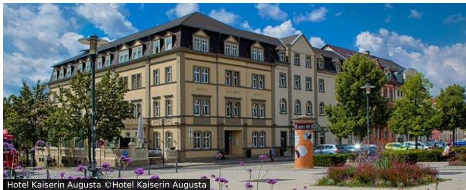
Hotel Kaiserin Augusta