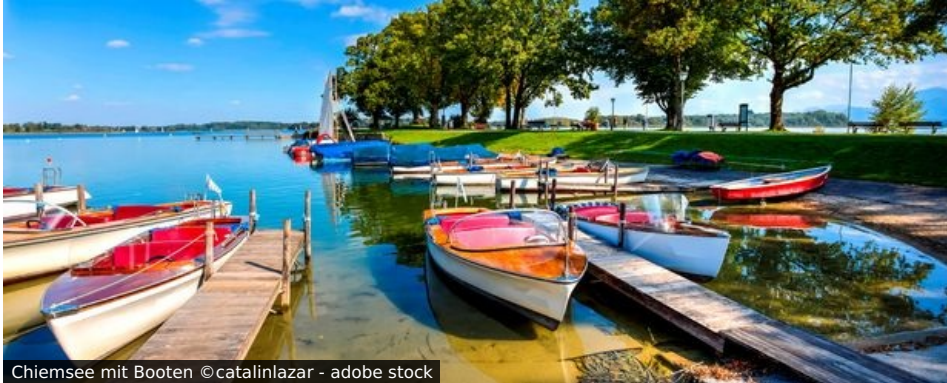
Chiemsee mit Booten