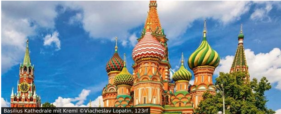
Basilius Kathedrale mit Kreml