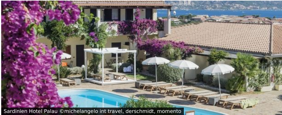
Sardinien Hotel Palau