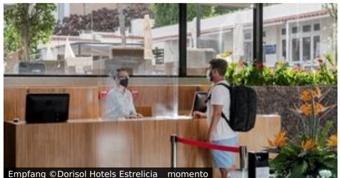
Empfang ©Dorisol Hotels Estrelícia _ momento

Lage und Ausstattung: Das Hotel Estrelícia liegt zusammen mit den beiden Dorisol Schwesterhotels inmitten Madeiras schönem und beliebten Hauptort Funchal, umgeben von zahlreichen Restaurants, Bars und Geschäften. Bis zu den bekannten Lido Meeresschwimmbädern und zum Meer mit Promenade sind es ca. 10 Gehminuten. Die sehenswerte Innenstadt ist ca. 2 km entfernt. Diese einladende Unterkunft verfügt über einen schönen Swimmingpool (Liegen und Sonnenschutz inklusive), an den direkt das gepflegte und beliebte Snackrestaurant mit Bar angrenzt. Zudem verfügt das Hotel auch über ein Hallenbad mit Sauna und Whirlpool. In der Bar im Innenbereich gibt es mehrmals pro Woche Abendunterhaltung. Im Restaurant mit Außenbereich wird Frühstück und Abendessen serviert.