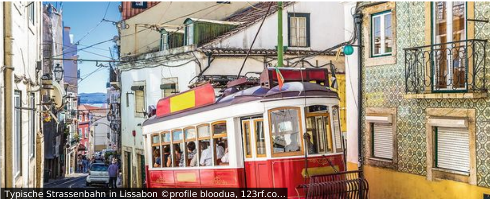
Typische Strassenbahn in Lissabon

Kaum landet Ihr Flieger, schon spielt Portugals Hauptstadt erste Trümpfe aus. Als glitzernd weiße Perle auf sieben Hügeln verströmt sie den Duft des Ozeans und lockt mit lebhafter Gastronomie inmitten labyrinthartiger Gassen. Um Lissabon noch tiefer in die Karten zu schauen, brauchen Sie uns nur zu folgen.