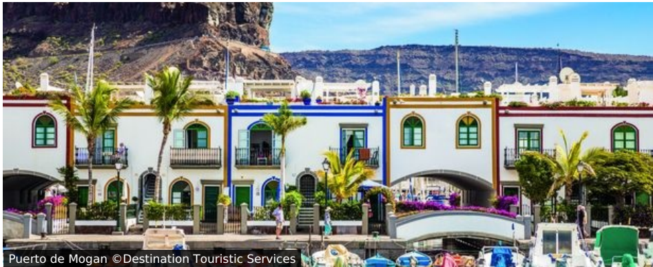
Puerto de Mogan

Sie mögen es auch im eisigen Winter oder nasskalten Herbst lieber frühlinghaft muckelig? Dann ist Gran Canaria das Ziel Ihrer Träume – schließlich trägt die größte der Kanarischen Inseln nicht zufällig den Beinamen „Insel des ewigen Frühlings“. Und natürlich fahren wir nicht nur zum Blumenpflücken dorthin, sondern werden die Schönheiten des topographisch und kulturell so vielfältigen Eilands in allen Facetten erkunden.