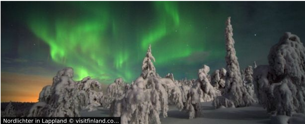
Nordlichter in Lappland

Lieben Sie den Winter? Knackige Kälte. Meterhoher Schnee. Verschneite Wälder so weit das Auge reicht. Kurze Tage, klare Nächte und als i-Tüpfelchen führen am Himmel die Nordlichter Ihren spektakulärsten Tanz auf. Wenn das der Winter ist, den Sie suchen und mögen, kommen Sie mit nach Lappland – genauer gesagt in das Wintersportparadies Levi. Ganz in der Nähe von Rovaniemi, wo wir dem Weihnachtsmann unsere Aufwartung machen, erleben Sie hier vier Tage Winterfreuden pur. Dazu gehört auch, dass wir alle Arten der Fortbewegung auf verschneiten Wegen selbst ausprobieren werden. Beim Besuch einer Rentierfarm lassen wir uns von speziell ausgebildeten Tieren in Schlitten durch die Wälder ziehen. Beim Hundeschlittenfahren lernen Sie sogar selbst, ein Huskygespann zu steuern.