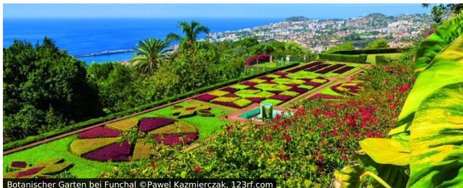
Botanischer Garten bei Funchal

Bom dia Lissabon, até breve Madeira! - Guten Tag Lissabon und auf ein baldiges Wiedersehen Madeira, viel mehr portugiesisch werden Sie auf dieser Reise nicht brauchen, denn natürlich werden Sie von einer deutschsprachigen Reiseleitung begleitet. Die beiden Grußformeln umreißen aber auch das Programm dieser Reise, das Ihnen das ehrwürdige, kontinentale Portugal ebenso nahebringen wird, wie seinen lebensfrohen Inselabteiler im Atlantik.