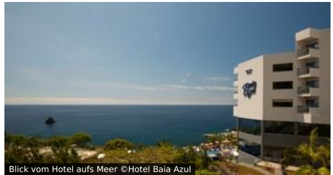
Blick vom Hotel aufs Meer