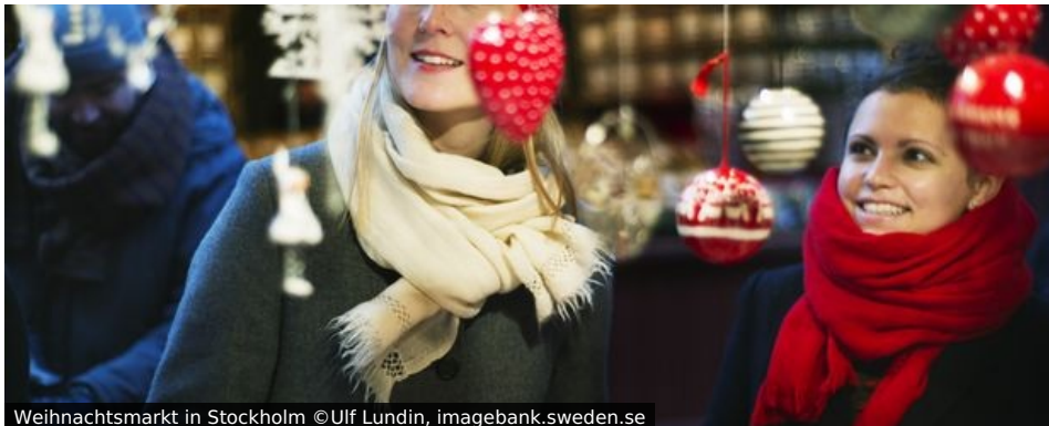
Weihnachtsmarkt in Stockholm

Wer einmal zur Adventszeit im blaugelben Möbelhaus eingekauft hat, weiß, dass die Schweden eine ganz besondere und stimmungsvolle Beziehung zur Advents- und Weihnachtszeit pflegen. Höchste Zeit, den „Glögg“ (Glühwein), das „Julbord“ (Weihnachtsbüffet) und die Lichterpracht im Vorfeld des Lucia-Tages einmal im Original zu erleben und nicht in Papptüten nach Hause zu tragen.