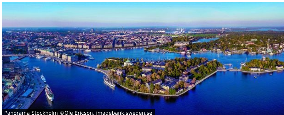
Panorama Stockholm

„Venedig des Nordens“, „Kleinste Großstadt der Welt“, „Hauptstadt von ABBA-Land“ – Stockholm hat so viele Beinamen wie Inseln. Und reichlich viel Wasser drum herum.