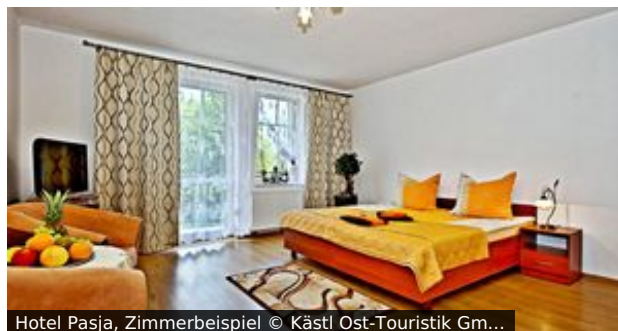
Hotel Pasja, Zimmerbeispiel

Bad Flinsberg ist ein kleiner aber sehr schöner Kurort mitten im Isergebirge im Südwesten Polens. Das Hotel Pasja (zu Deutsch: Leidenschaft) ist ein 2013 neu erbautes, wunderschön im dem malerischen Ort gelegenes Hotel. Die Unterkunft bietet einen hervorragenden Ausgangspunkt für Spaziergänge, Wanderungen und Radtouren. Medizinische Behandlungen und Rehabilitation verbessern Ihr Wohlbefinden und die Gesundheit.