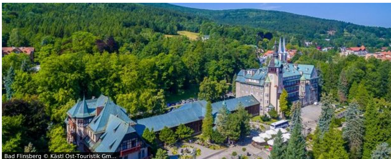
Bad Flinsberg © Kästl Ost-Touristik Gm...