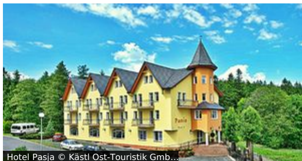
Hotel Pasja