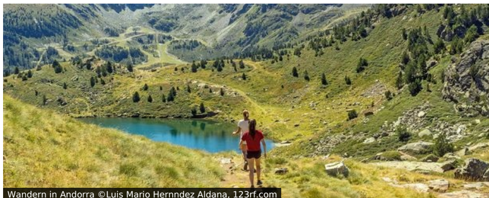
Wandern in Andorra

Zwergstaat - mit diesem Attribut wird Andorra wohl am häufigsten assoziiert. Und tatsächlich ist das Land in den Pyrenäen mit seinen gut 75.000 Einwohnern nicht gerade das größte unter der Sonne. Für uns aber ist etwas anderes wichtiger: Andorra ist mit allein 65 Gipfeln über 2.000 Meter der „Bergstaat“ schlechthin und damit ein Wanderparadies mit unerschöpflichem Potenzial von spektakulären Aus- und Einblicken. Zur Illustration: Hätte Deutschland pro Einwohner so viele Zweitausender, müssten rund um die Zugspitze noch einmal ca. 70.000 Gipfel Platz finden.