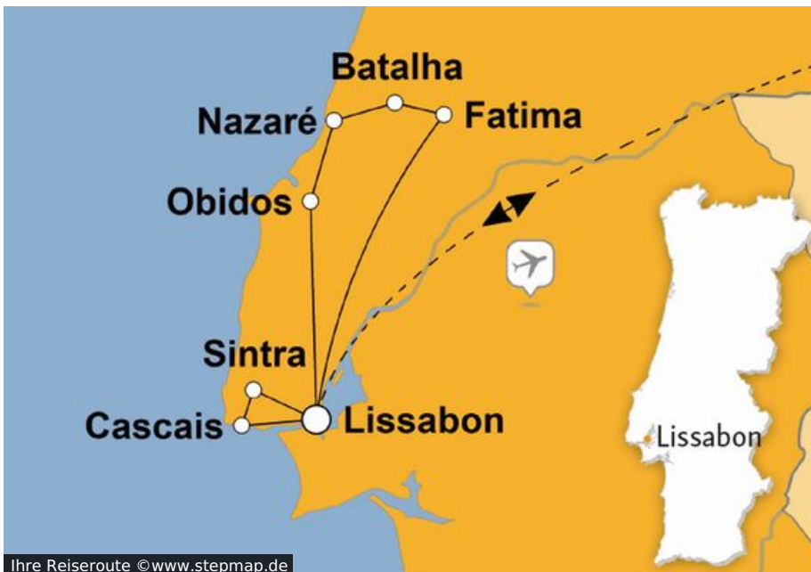
Ihre Reiseroute

Kaum landet Ihr Flieger, schon spielt Portugals Hauptstadt erste Trümpfe aus. Als glitzernd weiße Perle auf sieben Hügeln verströmt sie den Duft des Ozeans und lockt mit lebhafter Gastronomie inmitten labyrinthartiger Gassen. Um Lissabon noch tiefer in die Karten zu schauen, brauchen Sie uns nur zu folgen.