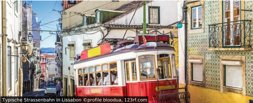
Typische Strassenbahn in Lissabon