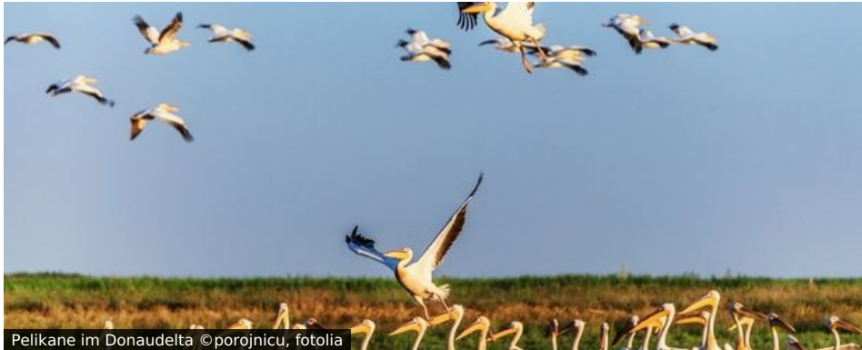
Pelikane im Donaudelta