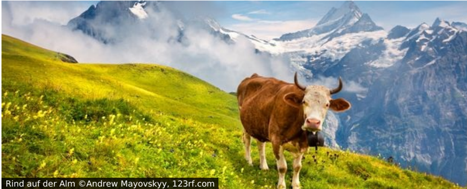
Rind auf der Alm