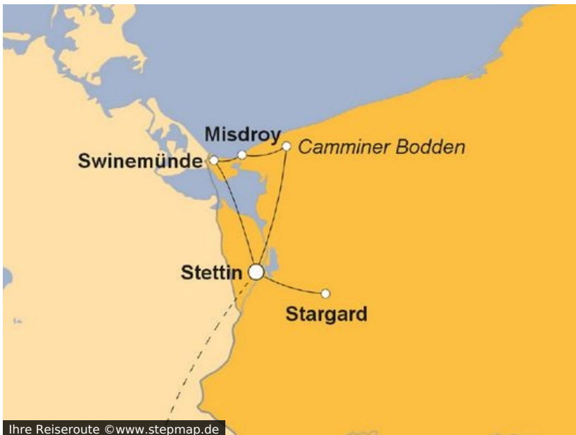
Ihre Reiseroute

Eine doppelte Grenzerfahrung der angenehmsten Sorte erwartet Sie auf dieser Silvesterreise nach Stettin. Denn Sie überschreiten nicht nur die Jahresgrenze, sondern auch die zwischen Deutschland und Polen – letztere gleich mehrfach.