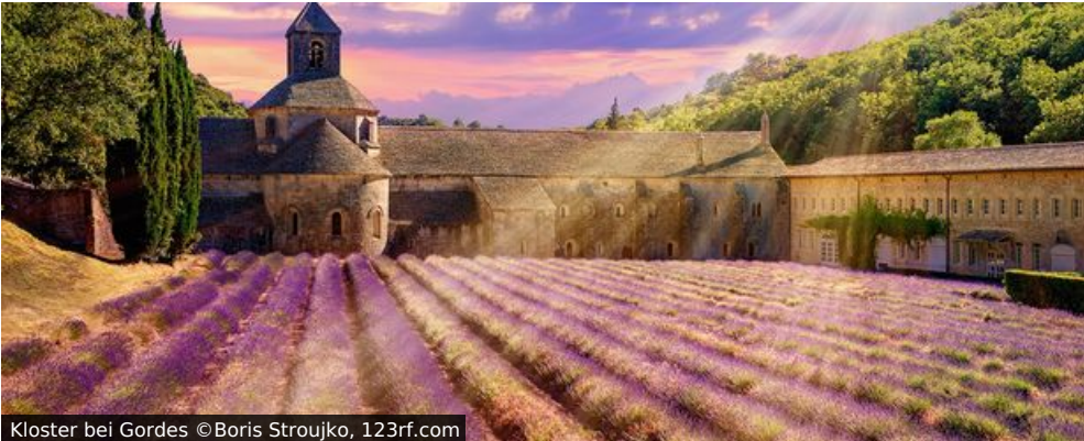
Kloster bei Gordes