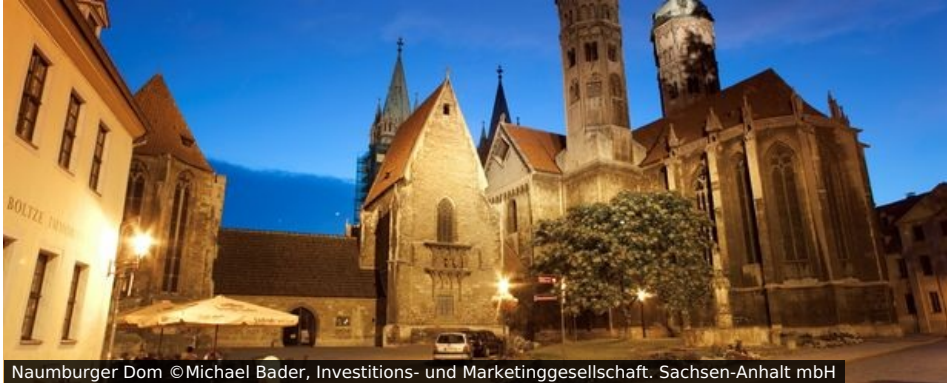
Naumburger Dom