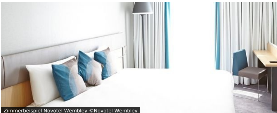
Zimmerbeispiel Novotel Wembley