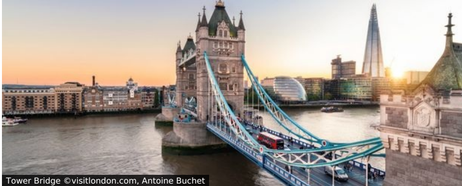
Tower Bridge

Brexit hin oder her: London und seine Umgebung waren schon den alten Römern eine Reise wert und werden es uns auch in Zukunft bleiben. Weil man bei einem Besuch nicht alles sehen kann, was die Millionenmetropole zu bieten hat, fährt man am besten immer wieder hin und setzt Schwerpunkte, für die man sich viel Zeit nimmt.