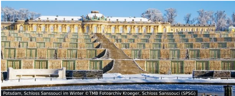
Potsdam, Schloss Sanssouci im Winter