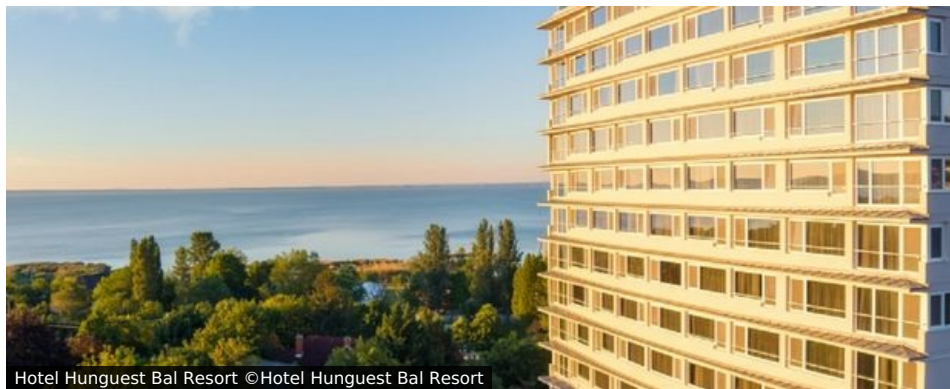
Hotel Hunguest Bal Resort