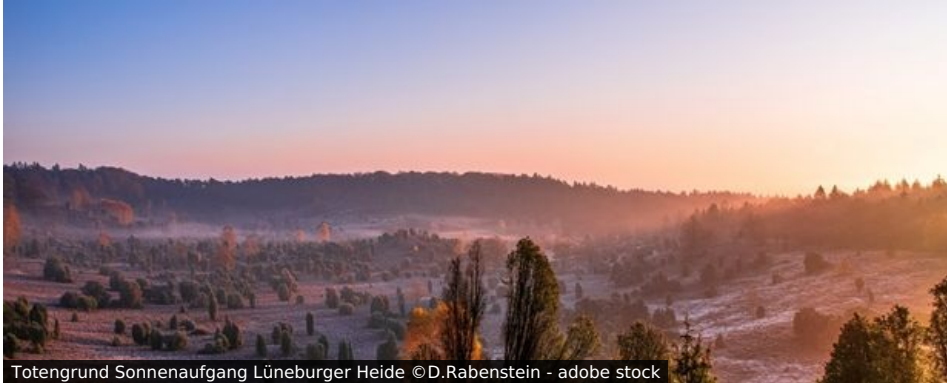
Totengrund Sonnenaufgang Lüneburger Heide