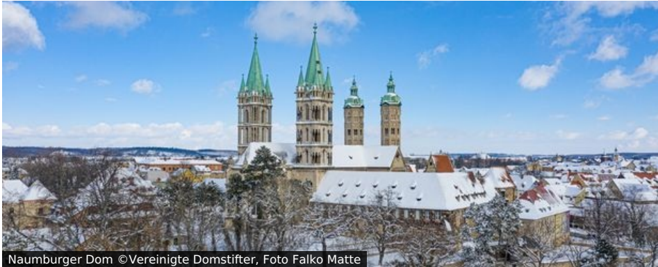
Naumburger Dom