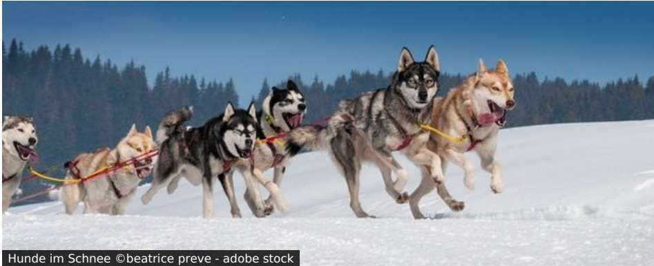
Hunde im Schnee