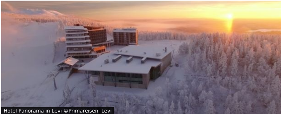
Hotel Panorama in Levi