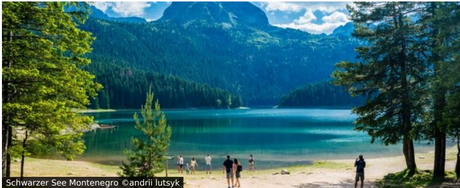
Schwarzer See Montenegro