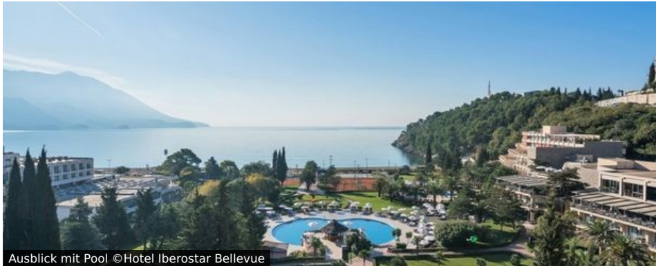
Ausblick mit Pool