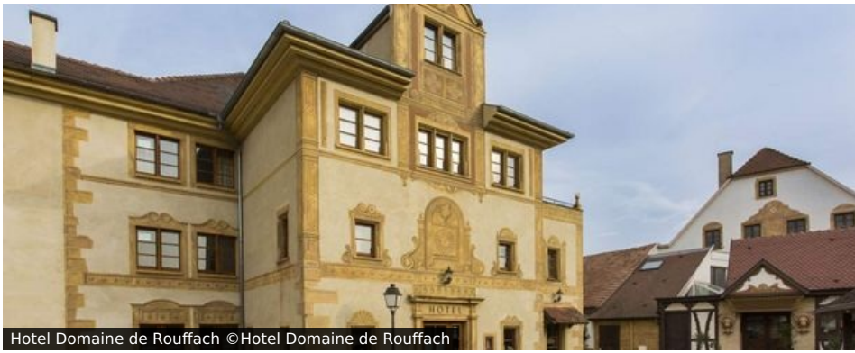
Hotel Domaine de Rouffach