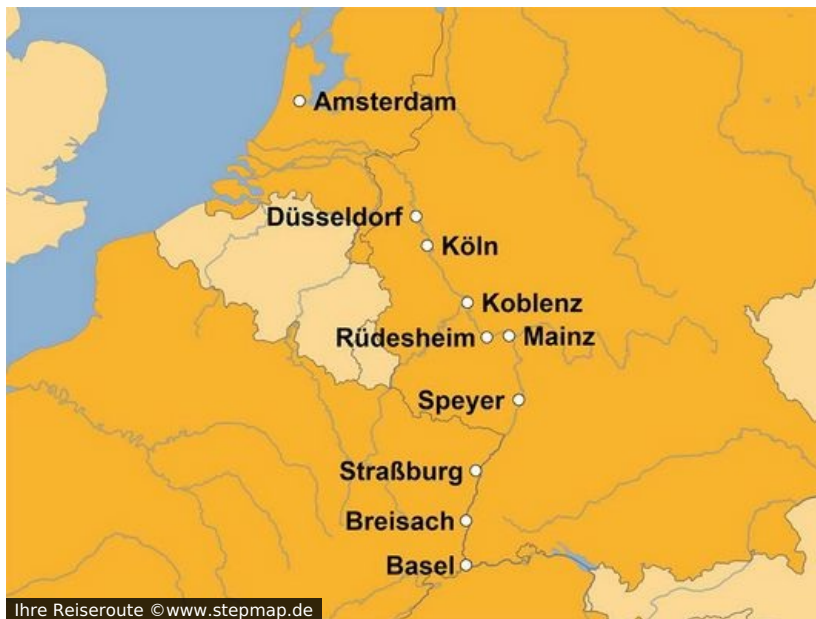
Ihre Reiseroute

Sie wissen ja sicher: Der Rhein wird erst ab Köln so richtig interessant, denn dann erst wird er zum wirklich großen europäischen Strom und es reiht sich Metropole an Metropole. Oder glauben Sie, der naturnähere Oberrhein wird viel zu häufig unterschätzt und deshalb viel zu selten bereist? Können wir uns wenigstens drauf einigen, dass das Obere Mittelrheintal zwischen Bingen und Koblenz mit seinen unzähligen Burgen und der Loreley nicht umsonst zum UNESCO Weltkulturerbe zählt?