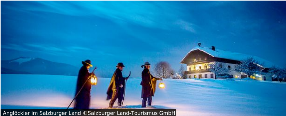
Anglöckler im Salzburger Land