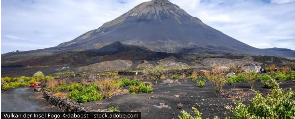
Vulkan der Insel Fogo