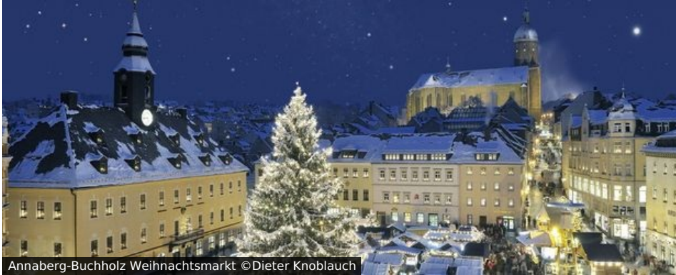
Annaberg-Buchholz Weihnachtsmarkt